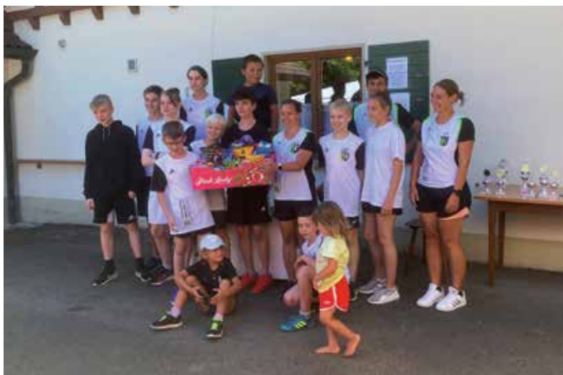
Die erfolgreichen Teilnehmerinnen und Teilnehmer beim 39. Cross-Biathlon in Zogenweiler