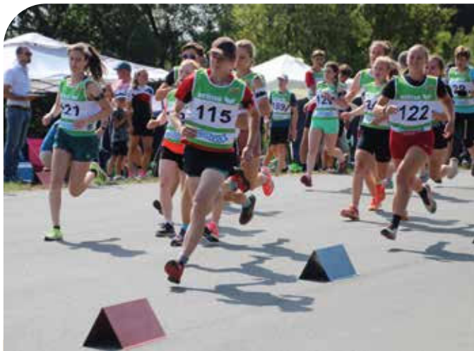
Die Damen nach dem Start zum Lauf

Vom 22. Bis 24. Juli fand in Neubau/Fichtelberg mit der DM Sommerbiathlon KK die erste der drei Deutschen Meisterschaften im Sommerbiathlon/Targetsprint statt. Mit zwei Gold-, drei Silber- und drei Bronzemedailles in den Einzeldisziplinen und einmal Gold, einmal Silber und einmal Bronze in den Staffelwettbewerben, kehrten die Sportler aus unserem Verbandsgebiet wieder einmal sehr erfolgreich von den Deutschen Meisterschaften im Sommerbiathlon mit dem Kleinkaliber zurück. Wie interessant und spannend Sommerbiathlon Cross sein kann, zeigten die Sportler an den zwei Wettkampftagen bei sehr hochsommerlichen Temperaturen wieder einmal eindrucksvoll.