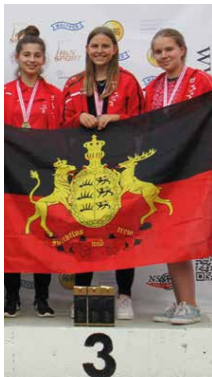
Die LG-Mannschaft 3 x 20 Schuss auf dem Siegerpodest