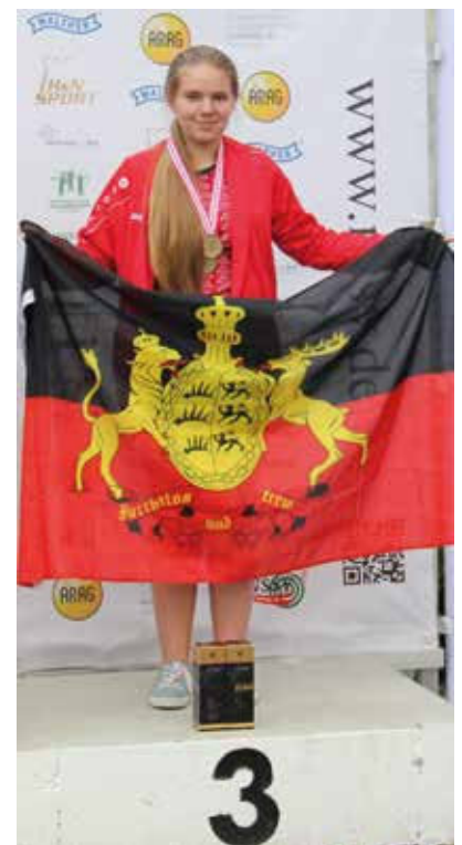
Platz drei mit dem Luftgewehr