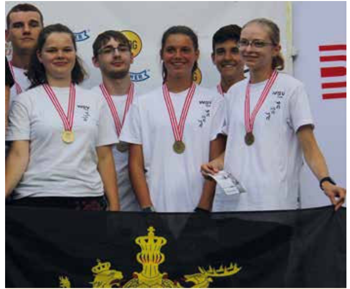
In der Mannschaftswertung Bogen freute man sich über den dritten Platz

Am Sonntag konnten sich beim Einschießen auf der Bogenschießwiese die sechs besten Sportlerinnen und Sportler qualifizieren. Das LP-Mix-Team