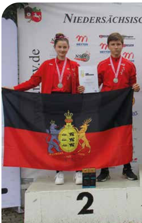
Das LP-Team Mix auf Platz zwei

Zehntel Rückstand auf Rang 6. Im Finale gaben unsere Pistolen-schützen alles. So schoben sie sich nach 98,2 Ringen zunächst auf Rang 4 und nach weiteren fünf Schuss dann mit 94,2 auf